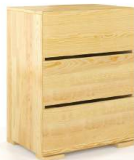
PINO - 3 CASSETTI - LARGH. 60CM