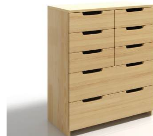
PINO - 8 CASSETTI