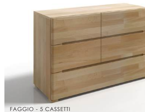
FAGGIO - 5 CASSETTI