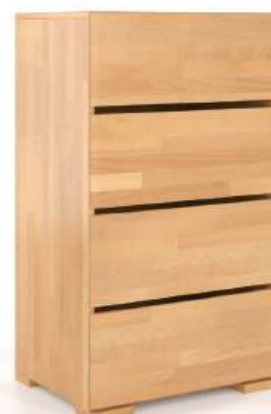
FAGGIO - 4 CASSETTI - LARGH. 60CM