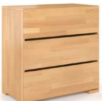
FAGGIO - 3 CASSETTI - LARGH. 80CM