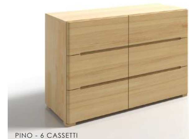
PINO - 6 CASSETTI