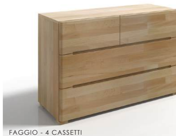
FAGGIO - 4 CASSETTI