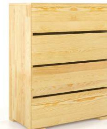
PINO - 4 CASSETTI - LARGH. 80CM