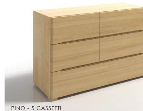
PINO - 5 CASSETTI