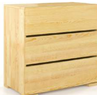
PINO - 3 CASSETTI - LARGH. 80CM