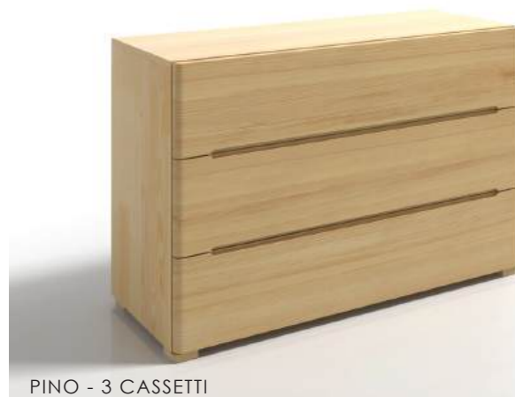
PINO - 3 CASSETTI