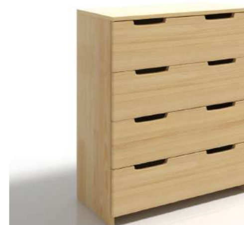
PINO - 4 CASSETTI

Il pannello interno del cassetto è realizzato con una tavola di HDF. Dipinta con vernici ecologiche, è possibile richiedere varie finiture come Naturale, Noce, Palissandro e Sbiancato.