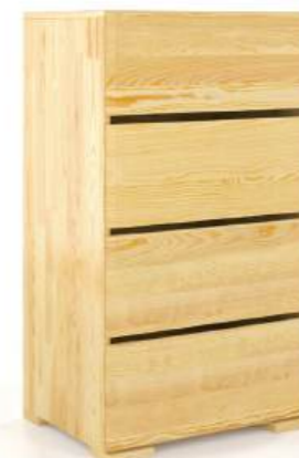
PINO - 4 CASSETTI - LARGH. 60CM