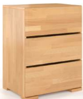
FAGGIO - 3 CASSETTI - LARGH. 60CM