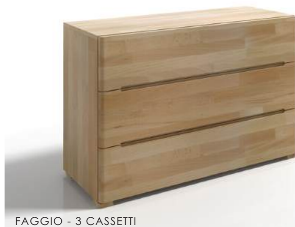
FAGGIO - 3 CASSETTI