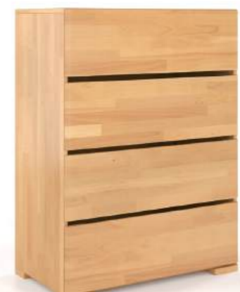
FAGGIO - 4 CASSETTI - LARGH. 80CM