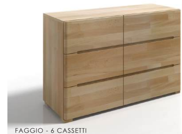
FAGGIO - 6 CASSETTI