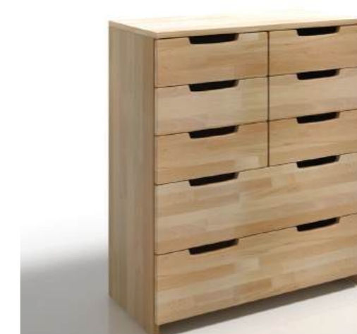
FAGGIO - 8 CASSETTI